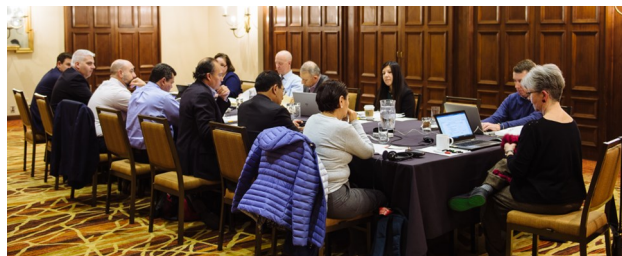
Miembros del equipo de manejo de la NAPPO (Comité Consultivo y de Manejo, Grupo Consultivo de la Industria y Comité Ejecutivo de la NAPPO) durante una reunión presencial en Montreal, Canadá.